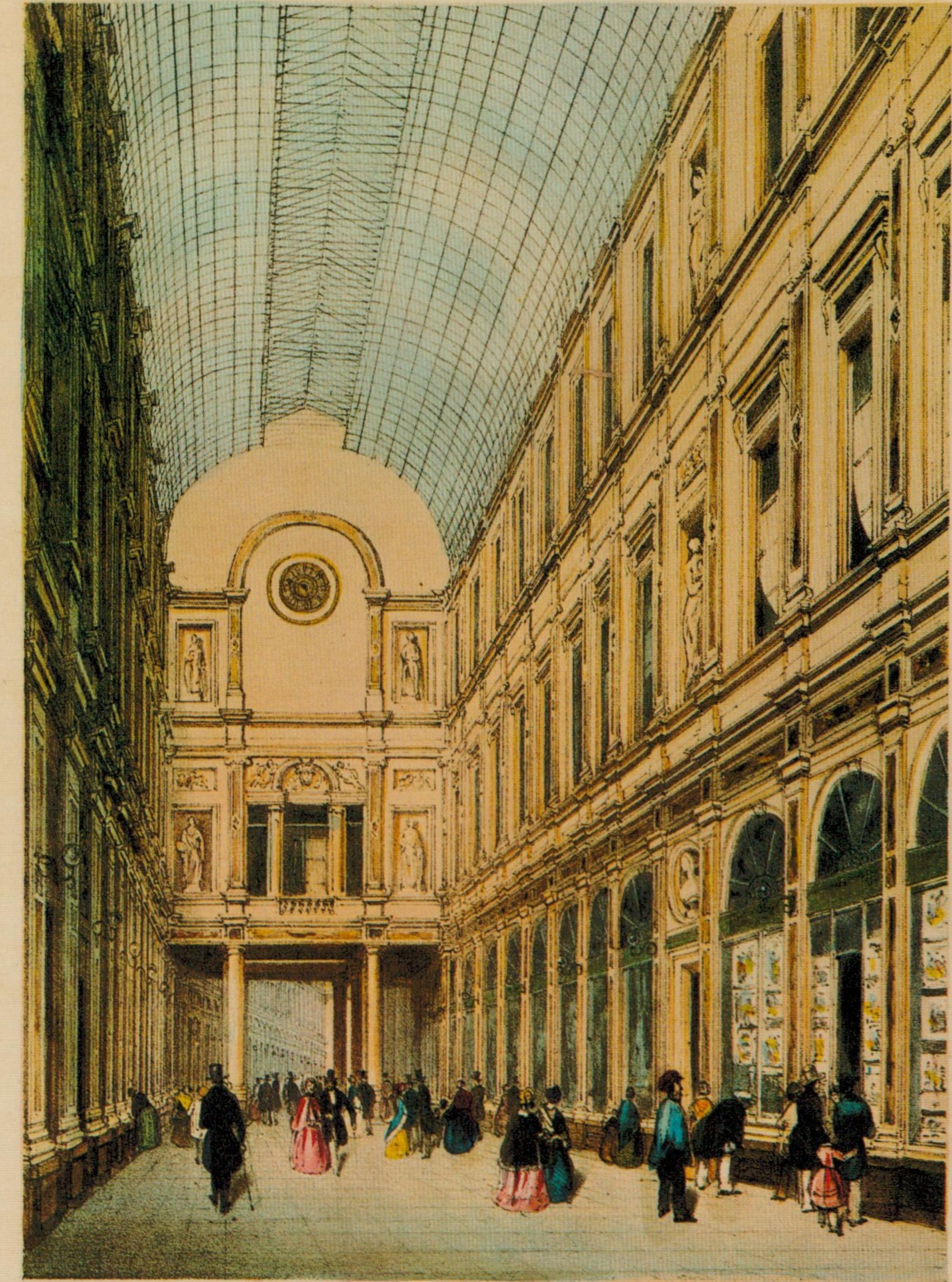
Intérieur des Galeries St. Hubert